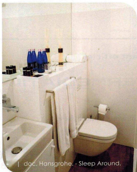
| doc. Hansgrohe. - Sleep Around.

La bonne adresse pour obtenir un réservoir de chasse d'eau , encastré ou externe, est celle