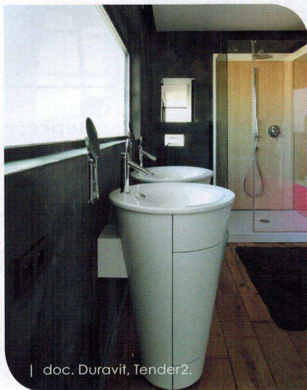
| doc. Duravit, Tender2.